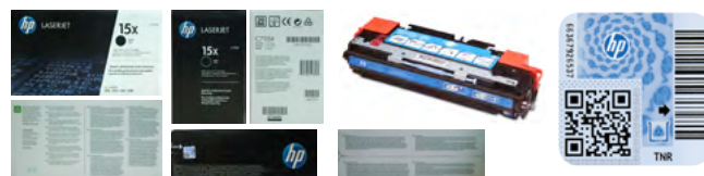
Foto di esempio per segnalare una cartuccia di toner sospetta