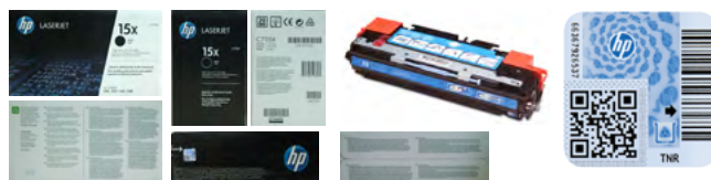
Primjeri fotografija za prijavu sumnjivoga tonerskog ispisnog uloška