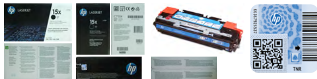
Eksempel på billeder til rapportering af en mistænkelig tonerpatron