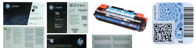
Esimerkkikuvia epäilyttävän väriainekasetin ilmoitukseen