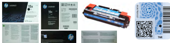
Foto di esempio per segnalare una cartuccia di toner sospetta