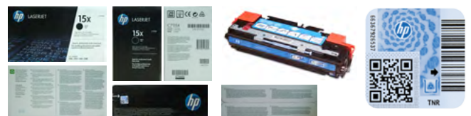
Voorbeeldfoto's voor het melden van een verdachte tonercartridge