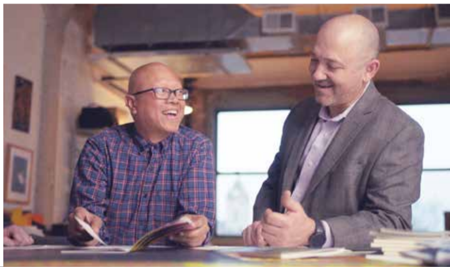
Des communications parfaites

Votre qualité vous définit. Voici la presse qui vous permet d'accepter chaque travail avec une confiance inébranlable et une qualité inégalée.