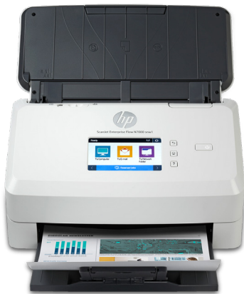
HP ScanJet Enterprise Flow N7000 snw1

為您的辦公室提供前所未見的高效能掃描服務。HP Scan Premium 幫助您節省時間及精準流暢擷取畫面。黑白掃描速度高達 75 ppm/150ipm 1 。每日建議使用量 7,500 頁。