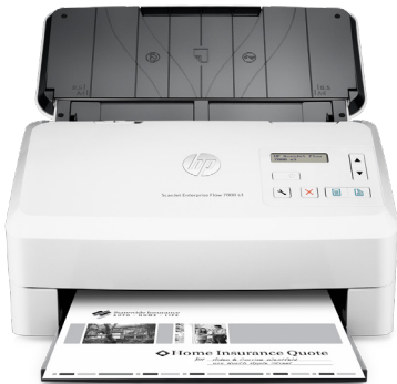
HP ScanJet Enterprise Flow 7000 s3