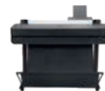
HP DesignJet T650